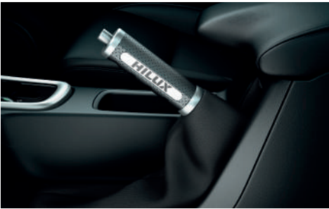
Шкіряний чохол ручки ручного гальма