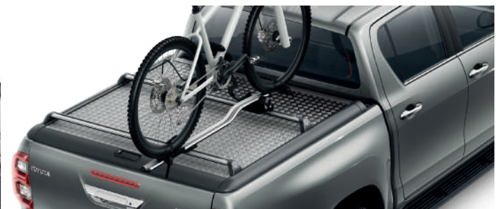
Кріплення для перевезення велосипеда на даху