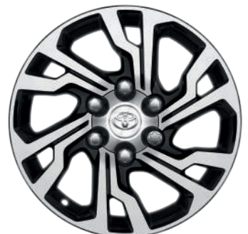
Колісні диски R18