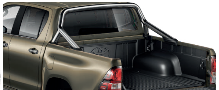
Дуга вантажної платформи